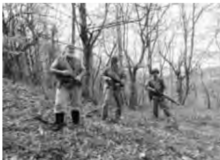
Una scena della Resistenza sulle montagne di Lizzano in Belvedere. A sinistra il partigiano assieme a due soldati alleati

Alla costruzione si adoperò la Organizzazione Todt, ideata dall'ing. Fritz Todt (1891-1942), l'uomo di Hitler che nel 1933 disegnò e dette il via alla moderna rete autostradale in Germania, finalizzata alla blitzkrieg, la guerra lampo, che dal 1939 piegò mezza Europa ma finì nel 1945 coi disastri nell'intero Continente. Nel retrofronte appenninico della Gotica, dove erano attive le brigate partigiane, i nazisti attuarono in borghi, case isolate, paesi, una sistematica strage di bambini, donne, uomini, anziani: a Santa Anna di Stazzema in Toscana; Ca' Berna (Lizzano), Ronchidoso (Gaggio), Marzabotto (Bologna); nel Modenese, Monchio, Costrignano, Susano. ■