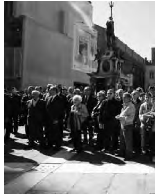
Bologna 21 Aprile. Cittadini ed autorità davanti al