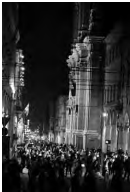
Bologna 24 Aprile. Il corteo mentre percorre via Indipendenza, a destra la cattedrale di San Pietro, dopo gli interventi davanti all'Hotel Baglioni, già sede del comando tedesco

Punto di partenza è stata piazza Scaravilli dove, nell'ottobre del '44,