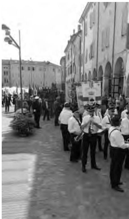
Carpi, 30 maggio. La partenza del corteo con i Medaglieri di molte sezioni ANPI provinciali e le bandiere di Brigate partigiane nel centro storico della città. L'arrivo nel cortile del Comune dove si è tenuta la manifestazione di avvio della Festa nazionale della nostra associazione