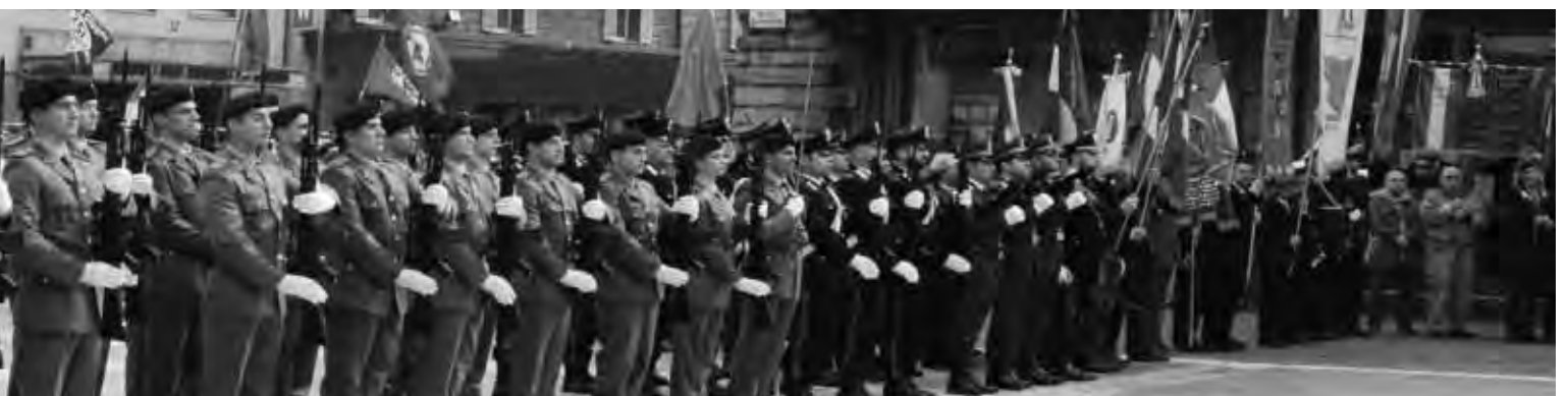
Sotto Bologna 25 Aprile. Il solenne picchetto d'onore schierato durante la cerimonia del 70° della Liberazione di Bologna