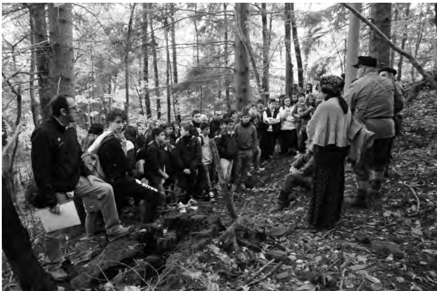
Il partigiano e la staffetta (figuranti) incontrano studenti nei boschi di Lizzano in Belvedere