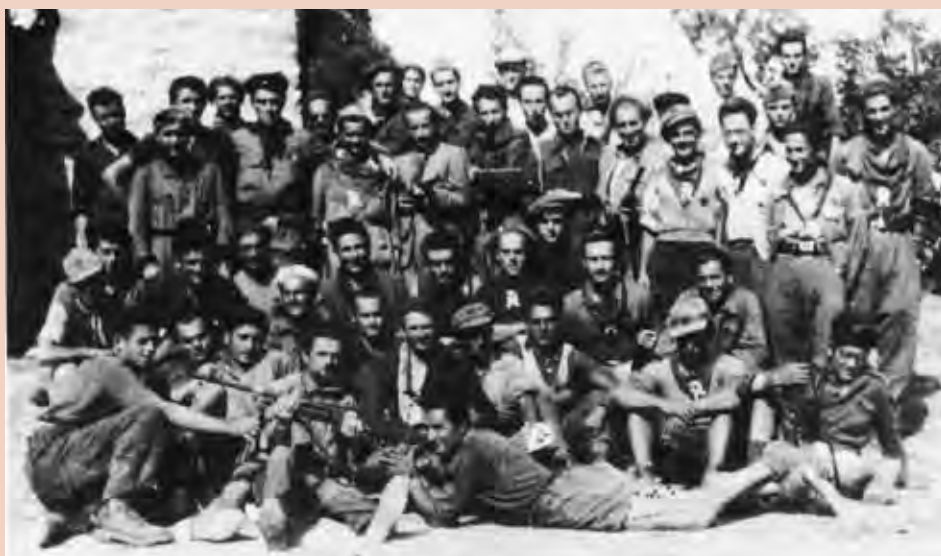
Ca di Malanca (Brisigbella), agosto 1944. La compagnia di "Gino"

Palazzuolo sul Senio in provincia di Firenze.