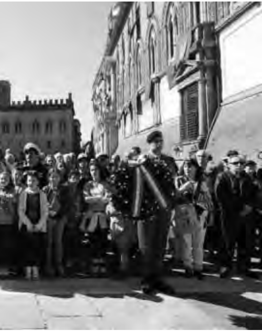
Sacrario dei partigiani davanti al Nettuno