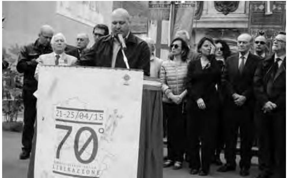
Bologna 25 Aprile. Il presidente della Regione Emilia Romagna Stefano Bonaccini mentre rivolge il saluto ai cittadini esortando la vigilanza sulle Istituzioni democratiche