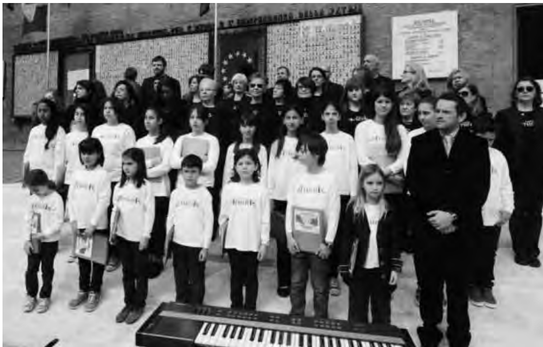
A sinistra: Bologna 25 Aprile. Il coro Athena sulla gradinata di Piazza Nettuno sotto il Sacario dei Caduti Partigiani, prima dell'esecuzione dell'Inno d'Italia