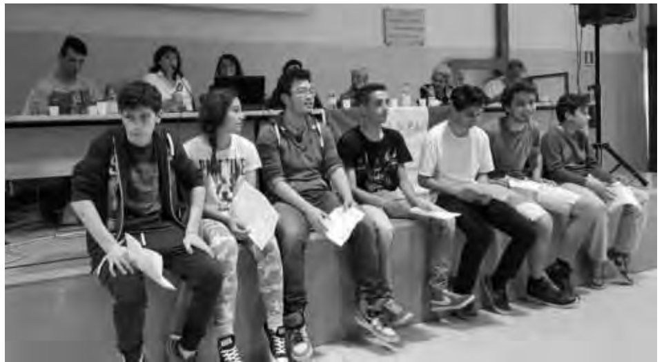
Ragazzi dell'ITIS durante l'incontro di studio per il 70° della Liberazione