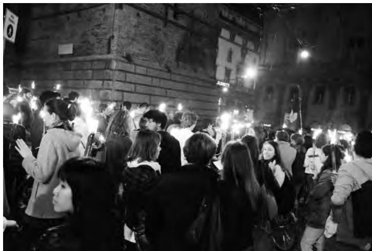
Bologna, 24 Aprile. Il corteo di studenti e cittadini in visita ai luoghi della Resistenza nella nostra città. Nella foto il corteo sotto le Due Torri

Non combattiamo con le armi di distruzione, perché per fortuna non siamo in guerra civile: ci sono suffi-