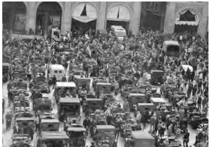
Bologna 25 Aprile. I mezzi militari della Colonna della Libertà schierati in Piazza Maggiore in attesa della partenza alla volta di Parma seguendo il percorso della Liberazione